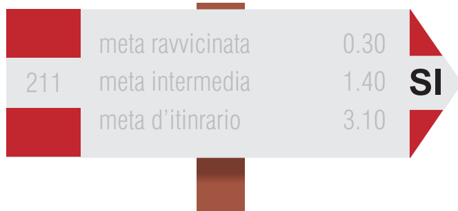
Tabella segnavia per itinerari escursionistici a lunga percorrenza (55x15 cm)

Indica la direzione delle località di destinazione del sentiero e il tempo per raggiungerle.