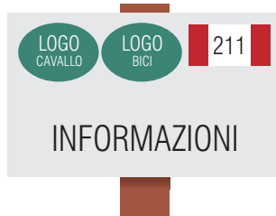
Tabella per uso anche equestre e ciclistico dei sentieri (25x15 cm)

Indica il transito adatto anche in bicicletta o a cavallo.