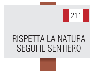
Tabella "Rispetta la natura segui il sentiero" (25x15 cm)

Evidenzia l'interesse di un sentiero: Sentiero geologico, Sentiero Storico, Sentiero Natura ecc.