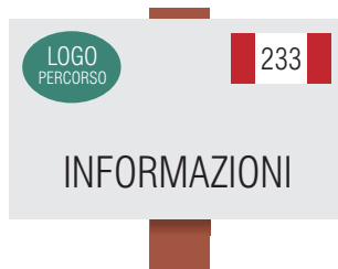
Tabella per sentieri tematici (25x15 cm)

Indica la località in cui ci si trova e la quota altimetrica