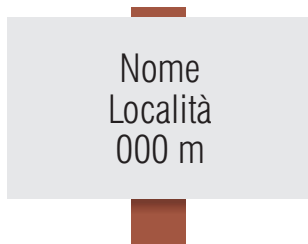
Tabella località (25x15 cm)

E' come la normale segnavia con l'aggiunta della sigla del percorso nello spazio riservato.