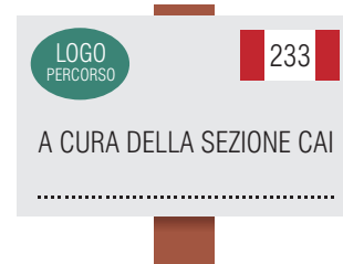
Tabella di adozione sentiero (25x15 cm)

Indica il transito adatto anche in bicicletta o a cavallo.